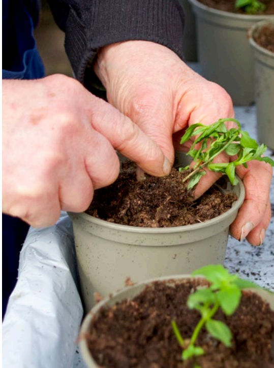
Det blir många omplanteringar på värkanten och Vanja är noga med att plocka bort fula blad.